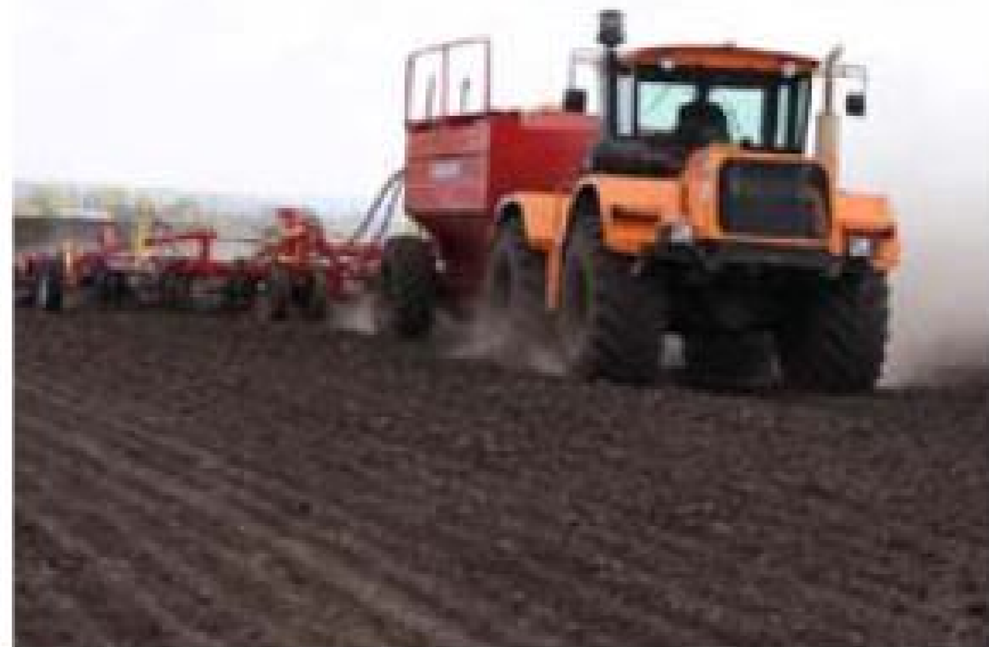
Трактор «Станислав» на посевной в полях

Нижегородские земли богаты славными традициями и историей. Село известно со времён Ивана Грозного. В этих местах велись последние сражения на закате эпохи монголо-татарского ига. До сих пор при сельхозработках находят артефакты, связанные с теми далёкими событиями. Вместе с инфраструктурой села будет возрождён его музей, который расположится в общественном центре.