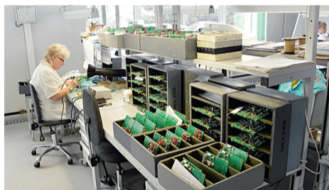
Участок сборки производственного департамента АПЗ в Рязани

все с переходом в состав АПЗ надеются только на лучшее. Увеличения объёмов производства не боятся, даже наоборот – ждут его, ведь если есть заказы, значит, будет и зарплата.