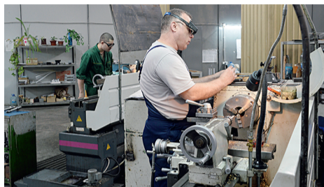
Механообработывающее производство производственного департамента АПЗ в Рязани

Трудятся сейчас в ПД около 300 человек, средний возраст сотрудников 45 лет, есть и старожилы, работающие практически с основания предприятия, но много и молодёжи. Коллектив работоспособный, в чём мы смогли убедиться, пообщавшись с представителями рабочих профессий. Несмотря на различия в возрасте, квалификации и стаже,