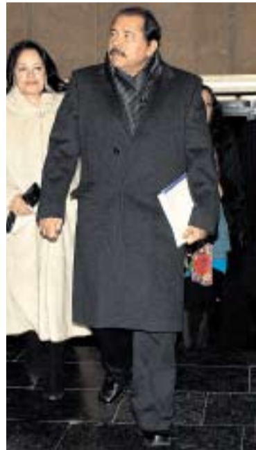
↑ Даниэль Ортега одним из первых признал независимость Абхазии и Южной Осетии

Уместно сказать, что Никарагуа играет заметную роль на международной арене. Ее представитель бывший министр иностранных дел Мигель д'Эското Брокман являлся председателем Генеральной Ассамблеи ООН. Выступая на открытии 63-й сессии Генассамблеи, он обрушился с резкой критикой в адрес Соединенных Штатов, затеявших военную интервенцию в Ирак, которая, по его словам, повлекла за собой гибель 1,2 млн человек. Касаясь ситуации в Закавказье, оратор счел совершенно недопустимым нарушение грузинскими властями Устава ООН и добавил, что «действия Грузии в отношении Южной Осетии являются агрессией». Не преминул он раскритиковать и продолжающееся более сорока лет американское эмбарго на торговлю с Кубой. Ведь США не считаются с «95% стран — членов ООН», постоянно принимающих резолюции с осуждением блокады острова.