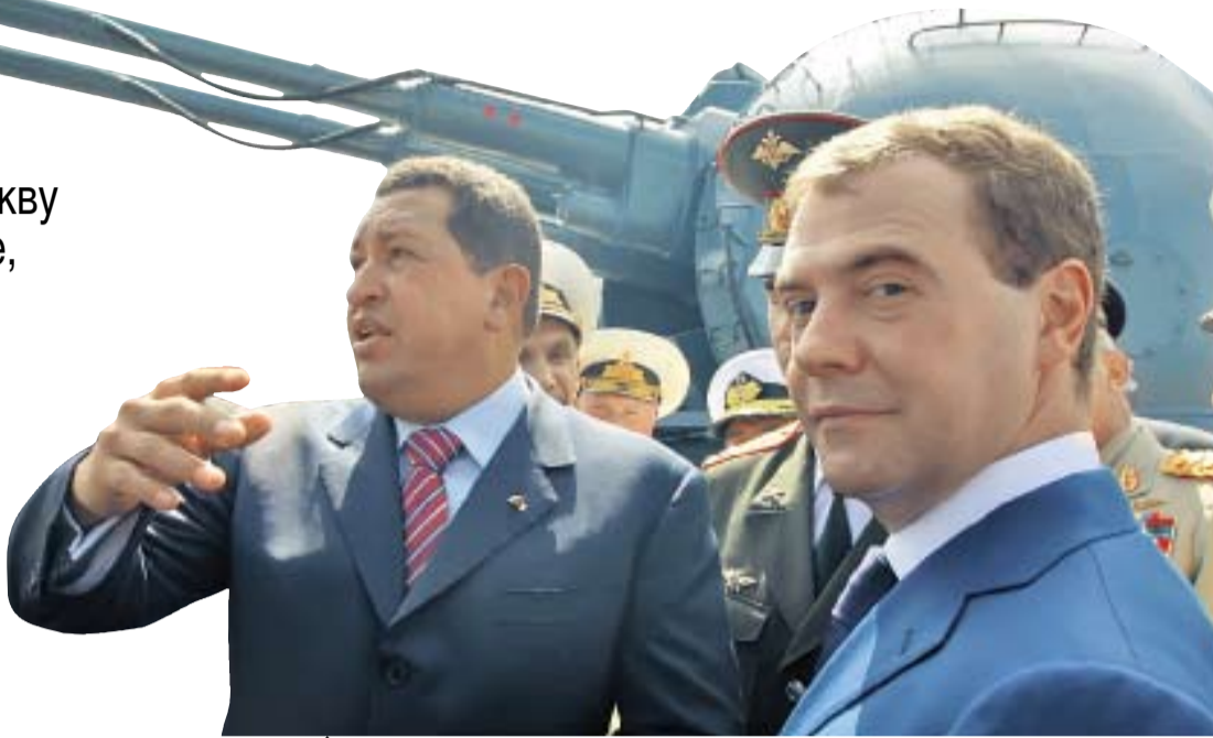
↑ Венесуэла и Россия готовы и дальше развивать сотрудничество в военно-технической сфере

Так случилось, что в силу самых различных обстоятельств и факторов сегодня многие наиболее верные друзья России, готовые выразить ей искреннюю солидарность и откликнуться на призывы, находятся не по соседству, а расположены за десятки тысяч километров, в Западном полушарии. Это страны, входящие в Боливарианский альянс, костяк которого составляют Венесуэла, Куба, Боливия и Никарагуа.