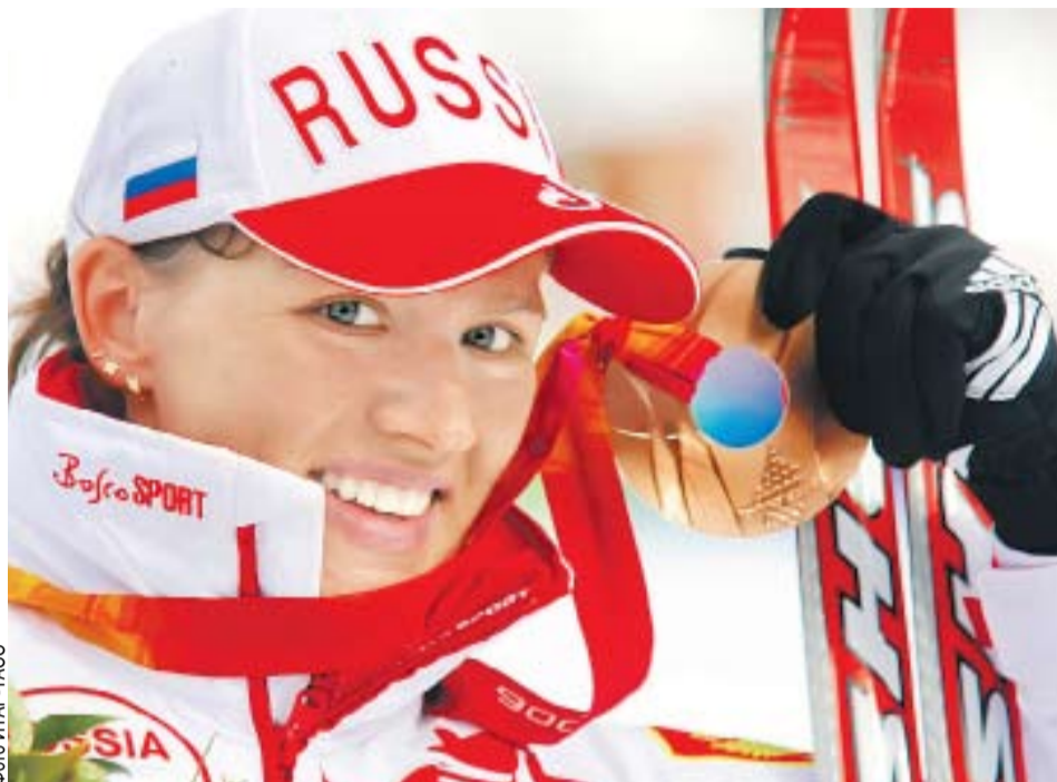
↑ Теперь бронзовый призер Игр-2006 в Турине Алена Сидько сможет выйти на лыжню через два года

— Трудно сказать. Я думаю, что Иван Скобрев «выстрелит» на стайерских дистанциях, если голландец Свен Крамер сломается. Это главный противник Вани. И Евгений Лаленков будет впереди на 1000 м, если вдруг сдадут нервы у явного лидера — американца Шани Дэвиса. В коньках, повторю, не раз бывало, когда фавориты почему-то проигрывали тем, на кого вообще никто не рассчитывал.