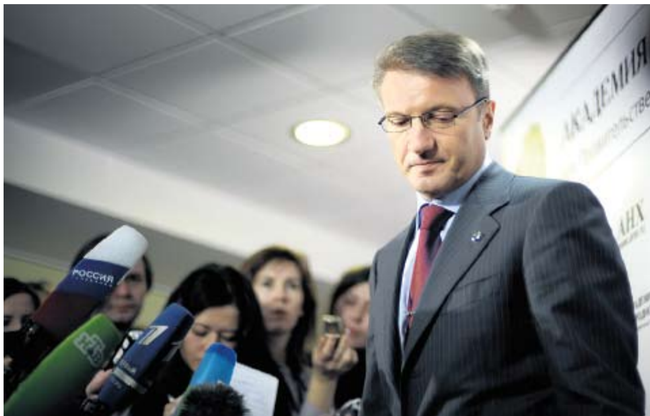
По мнению Германа Грефа, рынок нефти в этом году претерпит изменения

На текущий момент Россия – это сырьевое государство, управленческие институты которого пережили последний экономический спад за счет ресурсов Стабфонда. Таково краткое резюме выступлений отдельных экспертов форума. Однако, по словам министра финансов Алексея Кудрина, кризис еще даст о себе знать – при помощи проблемных активов на балансах банков. За активами стоят кредиты, предоставленные реальному сектору и сфере услуг. Готовность предпринимателей рассчитаться с долгами в следующую пару лет и станет гарантией от резких перекосов в экономике. А главной задачей на новое десятилетие, судя по всему, будет постепенный отход от сырьевой модели развития. По подсчетам Минфина, при цене нефти около $70 за баррель дефицит бюджета в этом году составит 6,8%, в 2012-м – 3%. Существует и более амбициозный прогноз – 1% к 2012 году, но это в идеале. Интересно, что, например, в «единой Европе» размер бюджетного дефицита поставлен под особый контроль. Непременное условие членства в валютном союзе ЕС – соблюдение критериев конвергенции. Согласно одному из них дефицит бюджета страны-члена не должен превышать 3% от ВВП. Цель – не допустить ослабления евро. Притом что европейцы разработали достаточно гибкую систему, позволяющую вовремя выровнять ситуацию, злостным нарушителям действующего режима в конечном итоге приходится платить штраф. Среди тех, кто регулярно страдает от принятых правил, – Германия, которая