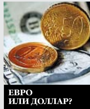
ЕВРО ИЛИ ДОЛЛАР?

Как американцы оценивают итоги первого года его президентства стр. 12