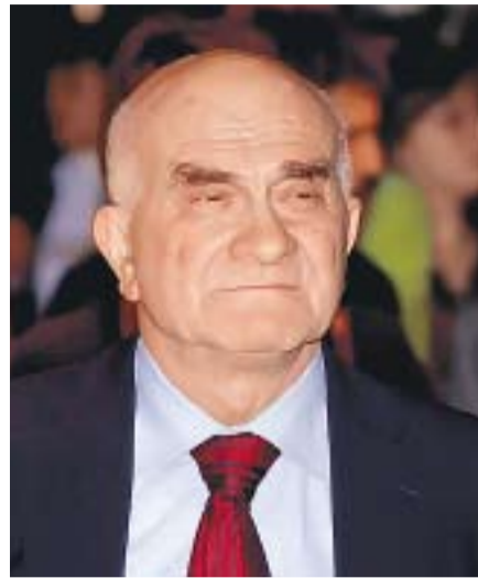
Евгений Ясин, научный руководитель Государственного университета – Высшей школы экономики