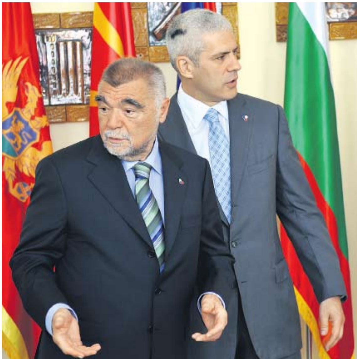
↑ Степан Месич и Борис Тадич не могут найти общий язык

Согласно действующей конституции высшим руководством Боснии является президиум, состоящий из представителей трех главных народов – боснийцев,