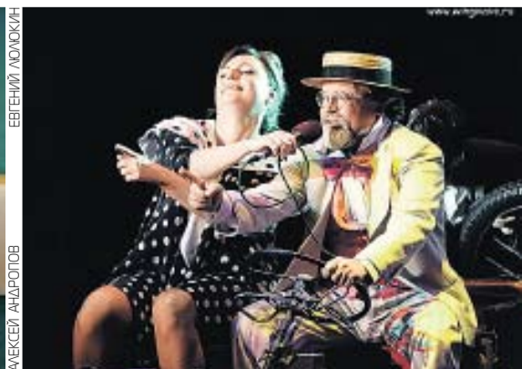
«ХАРМС! ЧАРМС! ШАРДАМ!...» ИЛИ БЕЗУМСТВО «ЭРМИТАЖА»