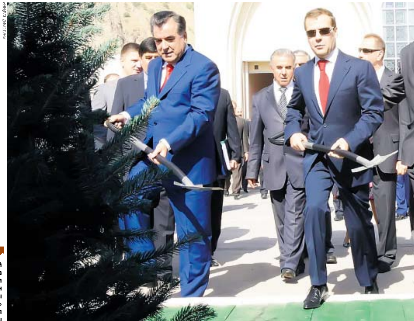
▲ ДМИТРИЙ МЕДВЕДЕВ И ЗЖАМАЛИ РАХМОН ГОТОВЫ «ЗАКОПАТЬ» НАКОПИВШИЕСЯ ПРОБЛЕМЫ