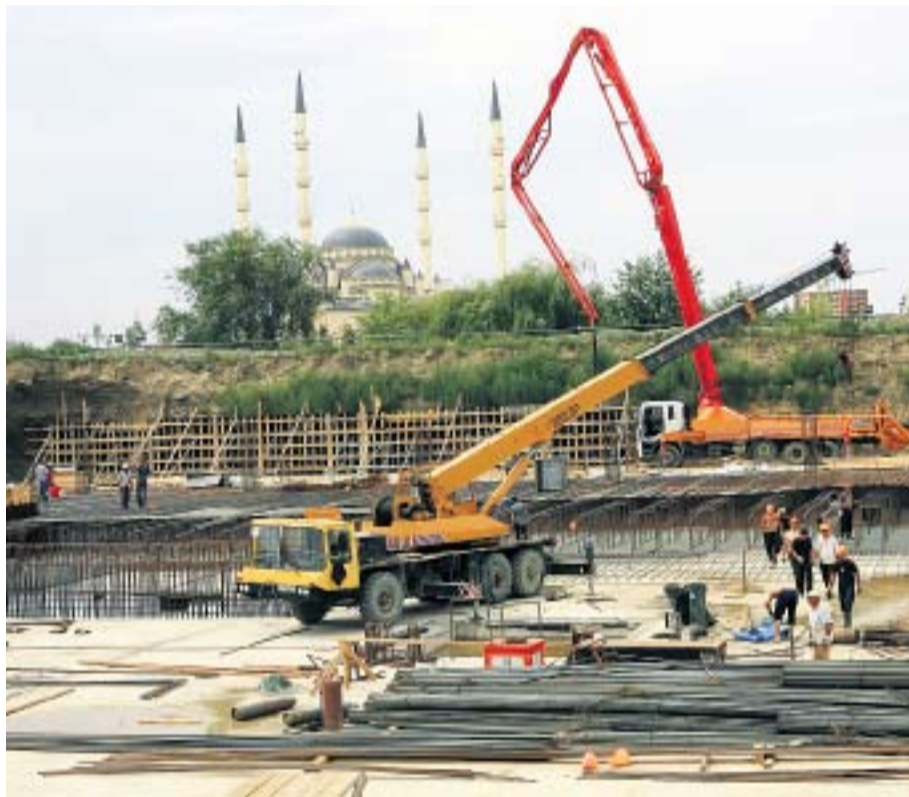
НА МЕСТЕ, ГДЕ ЕЩЕ НЕДАВНО БЫЛИ РУИНЫ, ВОЗВОДЯТСЯ СОРОКАЭТАЖКИ

говориться с ваххабитами миром: «Пожалуйста, сделайте, что хотите, но не навязывайте своих убеждений нам, не обвиняйте нас в ереси». Увы, диалог не получился», — заявил в беседе с автором этих строк незадолго до своего перехода на сторону федералов Ахмат Кадыров. Сегодня проблему ваххабизма в республике решают кардинально: человека, заподозренного в симпатиях к этому течению ислама, в лучшем случае ожидают долгие неприятные беседы в силовых ведомствах.