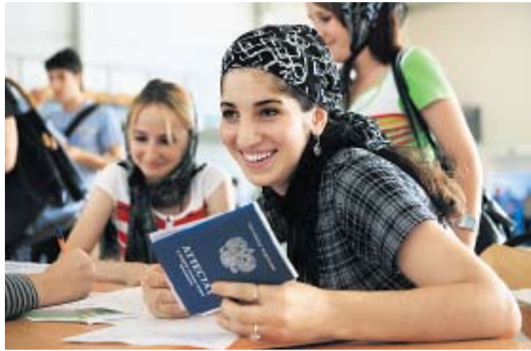
ЧЕЧЕНСКИЕ СТУДЕНТКИ ОБЯЗАНЫ ХОДИТЬ НА ЗАНЯТИЯ В ПЛАТКАХ