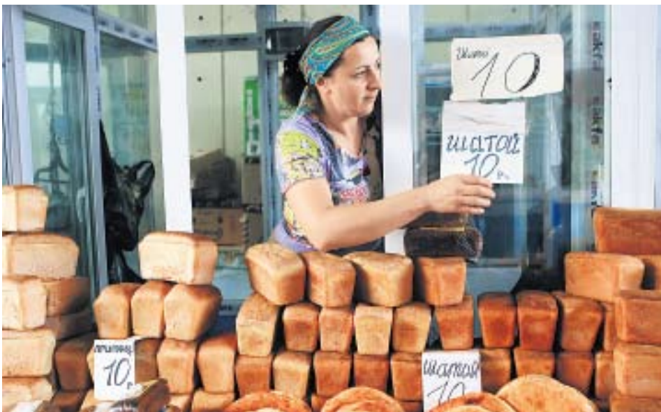
УСТАВШИХ ОТ ВОЙНЫ ЧЕЧЕНЦЕВ ВОЛНУЮТ В ПЕРВУЮ ОЧЕРЕДЬ ЭКОНОМИЧЕСКАЯ СТАБИЛЬНОСТЬ И БЕЗОПАСНОСТЬ

Вне зависимости от того, как относиться к отцу и сыну Кадыровым, очевидно, что привели их к власти, Кремлю удалось добиться относительной стабилизации в наиболее беспокойной республике Российской Федерации. ■