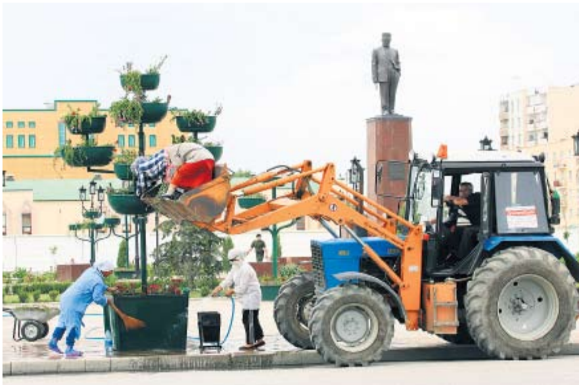
НА МЕСТЕ ДУДАЕВСКОГО ДВОРЦА ВОЗВЫШАЕТСЯ МОНУМЕНТ АХМАТУ ХАДЖИ