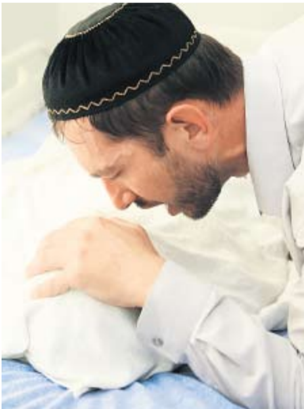
В ИСЛАМСКОМ ЦЕНТРЕ ИЗ БОЛЬНЫХ ИЗГОНЯЮТ ДЖИННОВ