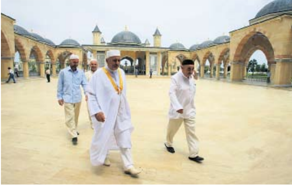
НА СЛУЖБУ ПУСКАЮТ ТОЛЬКО ПРАВОВЕРНЫХ