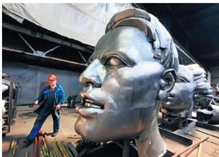
РАЗРОЗНЕННЫЕ ЧАСТИ ПАМЯТНИКА «РАБОЧЕМУ И КОЛХОЗНИЦЕ» ДО СИХ ПОР ХРАНЯТСЯ В ЗАПАСНИКАХ

После распада СССР, на волне реформ ВДНХ была переименована во Всероссийский выставочный