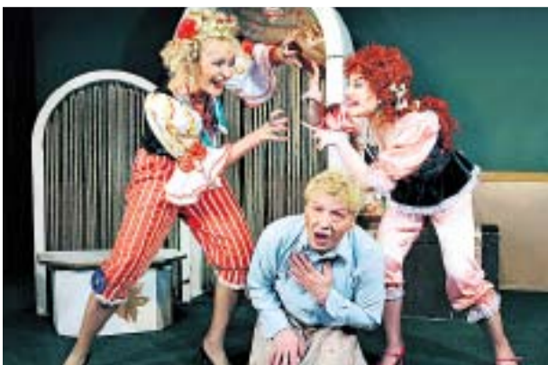
ОДИН ИЗ СПЕКТАКЛЕЙ ТРИЛОГИИ ЧИХАЧЕВА — «ЖЕНИТЬБА БАЛЗАМИНОВА»