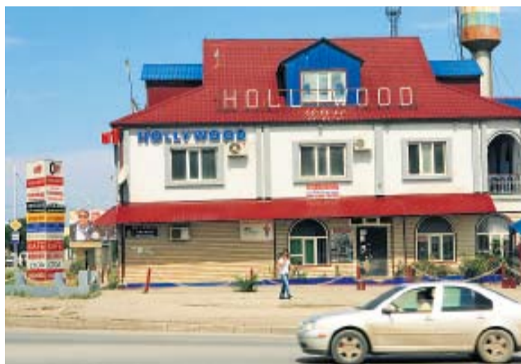
ГОРОДА РЕСПУБЛИКИ ПОХОЖИ НА ЕВРОПЕЙСКИЕ