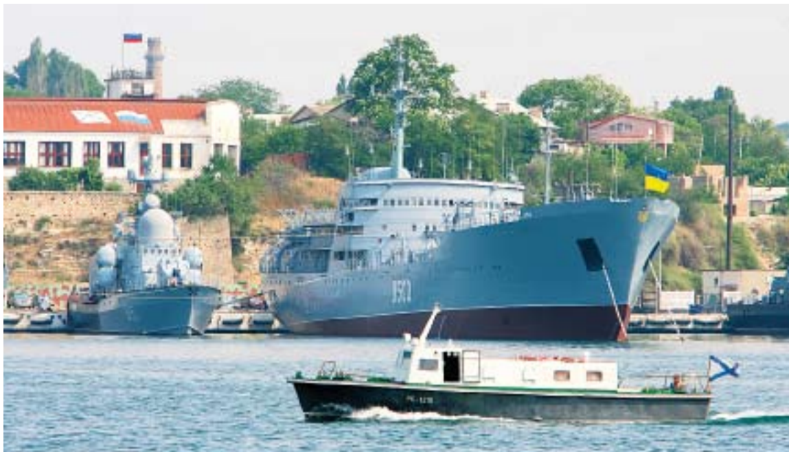
НА РЕЙДЕ СЕВАСТОПОЛЯ ПОКОЙ ПАТРИАРХА ОХРАНЯЛИ РОССИЙСКИЕ И УКРАИНСКИЕ КОРАБЛИ

Последняя святыня, которую патриарх Кирилл посетил на Украине, — Свято-Успенская Почаевская лавра в Тернопольской области. Там в день Почаевской иконы Божией Матери и празднования 450-летия принесения ее на Украину он возглавил Божественную литургию. ■