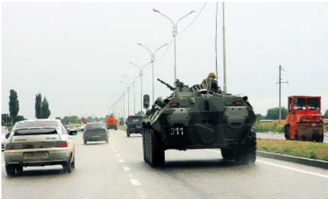
БЭТЭРЫ НА УЛИЦАХ ГРОЗНОГО — УЖЕ РЕДКОСТЬ