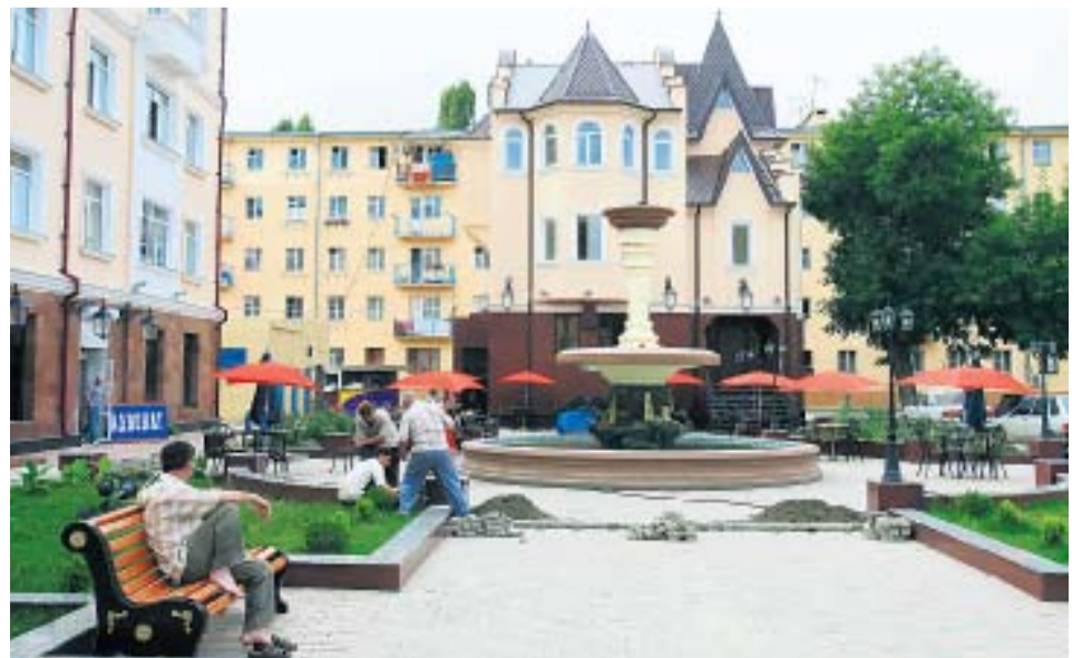
ГРОЗНЫЙ ПРИОБРЕТАЕТ ВИД ВПОЛНЕ ЕВРОПЕЙСКОГО ГОРОДА