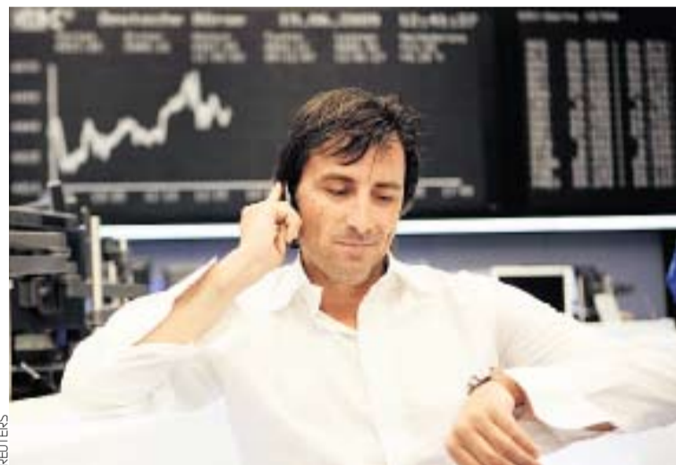
Кредитные рейтинги стран G8

Впрочем, такое положение вещей уже не устраивает власти развитых государств, которым приходится «расхлебывать» последствия круговой поруки инвесторов, и тех, кто их оценивает. На антикризисном саммите в ноябре 2008 года в Вашингтоне, где собрались 20 глав ведущих государств мира, много говорили о том, что необходимо определить новые правила работы рейтинговых агентств и что их деятельность нужно поставить под определенный надзор. В коммюнике саммита одним из пунктов было отмечено, что «регуляторы проверят деятельность рейтинговых агентств на предмет конфликта интересов», и дана рекомендация «большой тройке» повысить требования к раскрытию информации инвесторам и эмитентам. Правда, решения антикризисных саммитов пока выполняются ни шатко ни валко, но если положение мировой экономики будет ухудшаться, пойдет вторая волна кризиса, станет ясно, что делать что-то все равно придется.