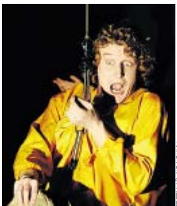
«БЕЗРАЗМЕРНОЕ КИМ-ТАНГО» — ВИЗИТКА ТЕАТРА ЛЕВИТИНА

«Безразмерное Ким-танго» – еще один спектакль, ставший визитной карточкой театра. Полный бред, мешанина, шутка, буффонада, поставленная на частушки Юлия Кима, плюс шикарные танцы и потрясающий юмор. «Капнист туда и обратно» – премьерный спектакль театра, который будет показан 29 и 30 августа. Неопишное действие по