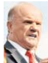
Геннадий Зюганов, лидер КПРФ:

— Что касается выборов в Московскую городскую думу, то, по нашему мнению, они имеют федеральное значение. Надо иметь в виду, что эффективность работы нынешних столичных властей в ближайшее время резко снизится. В Москве проживают около 7% населения РФ, при этом здесь собиралось примерно 26% всех налогов. Сегодня налоговая база усохла почти вдвое. Московские власти были вынуждены скорректировать бюджет города на 400 миллиардов рублей. Пятая часть населения столицы уже еле-еле сводит концы с концами. А тот медийный дурман, которым пользовалась власть многие годы, уже перестает действовать. Поэтому мы считаем, что у КПРФ есть реальная возможность улучшить свой результат на выборах. Это касается не только Москвы, но и других регионов. У нас есть огромный опыт ведения избирательных кампаний. Подготовлены кадры. Мы приняли решение, что тем регионам, где проходят выборы, окажут помощь соседи. Московской партийной организации будут помогать коммунисты из пятнадцати ближайших регионов.