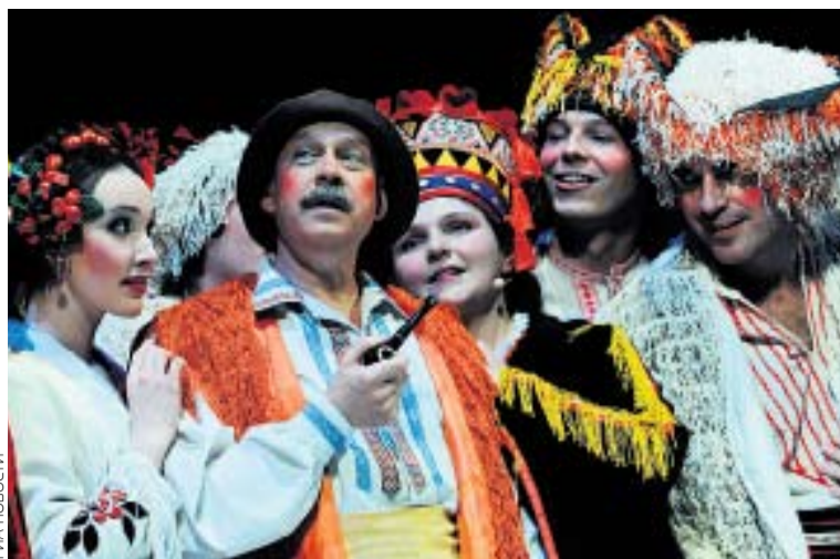
В ТЕАТРЕ ГОГОЛЯ — «НОЧЬ ПЕРЕД РОЖДЕСТВОМ»

– 19 августа мы играем «Секс в большом городе». Это веселый спектакль, пародия на знаменитый