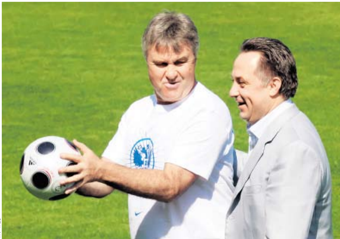
ВИТАЛИЙ МУТКО (СПРАВА) ПРЕДЛОЖИЛ ГУСУ ХИДИНКУ ПРЕДСТАВИТЬ РОССИЙСКУЮ ЗАЯВКУ НА ПРОВЕДЕНИЕ ЧЕМПИОНАТА МИРА-2018

— Мне кажется, тут все понятно. Есть правила игры. И в них четко сказано: результаты матчей, в