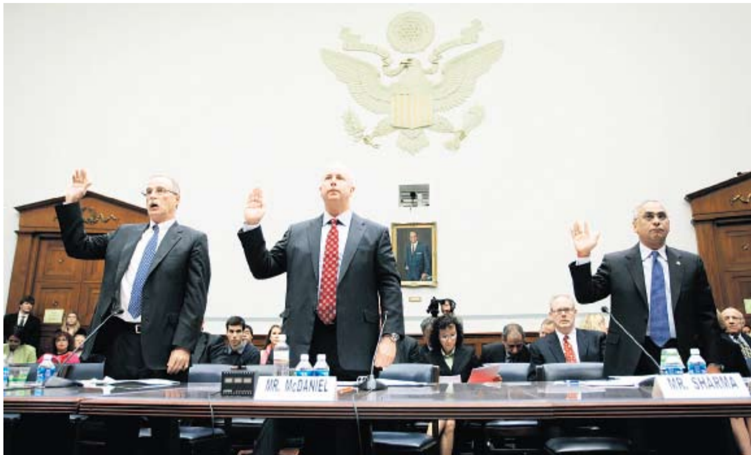
НА СЛУШАНИЯХ В КОНГРЕССЕ США ГЛАВЫ FITCH, MOODY'S И STANDARD & POOR'S ПОКАЯЛИСЬ ГОВОРИТЬ ТОЛЬКО ПРАВДУ, ХОТЯ ЗА СВОИ СЛОВА РЕЙТИНГОВЫЕ АГЕНТСТВА ОТВЕТСТВЕННОСТИ НЕ НЕСУТ