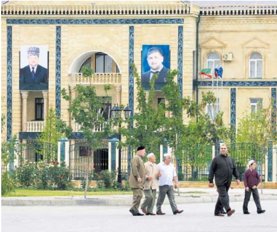
ПОРТРЕТЫ КАДЫРОВЫХ МОЖНО ВСТРЕТИТЬ ПОВСЮДУ

| Игорь Ротарь, Павел Кассин (фото), Грозный |