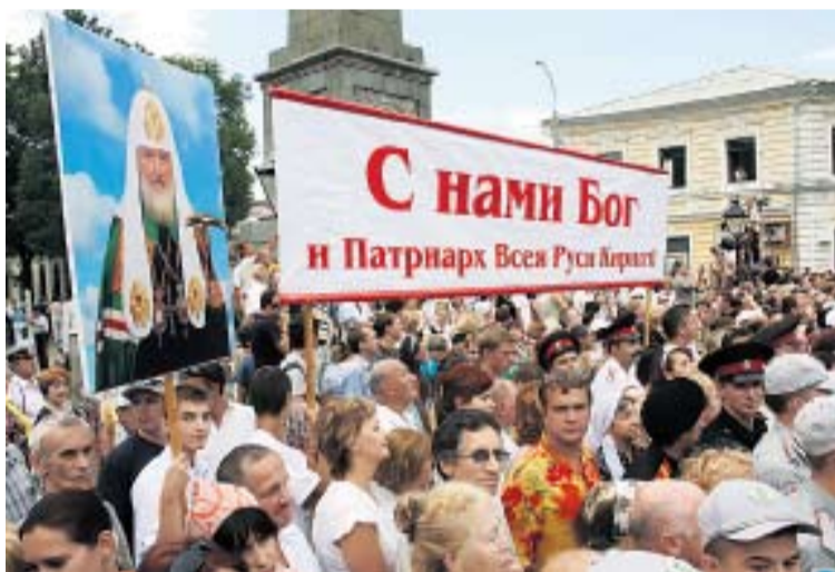
В КРЫМУ ПРЕДСТОЯТЕЛЯ РПЦ ЖДАЛИ С НЕТЕРПЕНИЕМ

Огромный собор, рассчитанный на три тысячи человек, в этот раз не смог вместить всех желающих помолиться вместе с патриархом. Несмотря на дождь, несколько сотен верующих не расходились и молились прямо у стен храма. А по окончании службы Предстоятеля