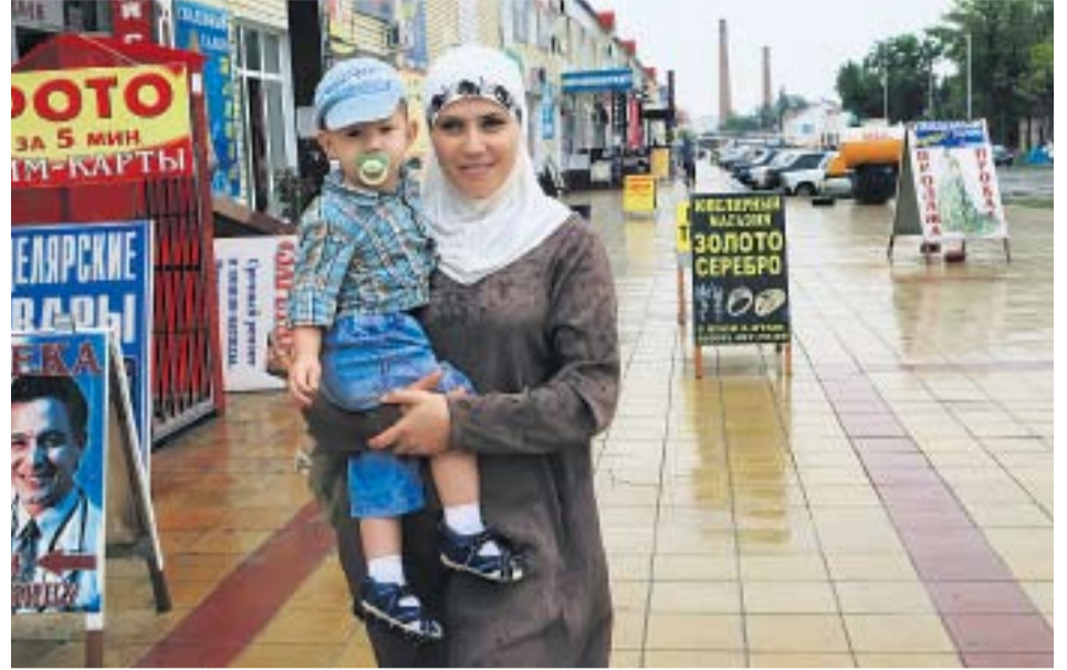
В ЧЕЧНЕ СЧИТАЮТ, ЧТО ЖЕНЩИНА С РАСПУШЕННЫМИ ВОЛОСАМИ ПОЗОРИТ НАЦИЮ