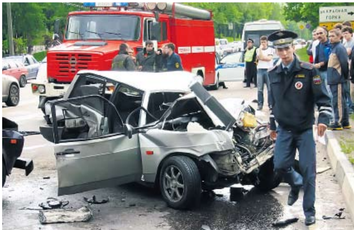
ДТП НА РОССИЙСКИХ ДОРОГАХ МОЖНО НАБЛЮДАТЬ КАЖДЫЙ ДЕНЬ. ПОРОЙ ОНИ ЗАКАНЧИВАЮТСЯ ТРАГЕДИЕЙ

Одно можно с уверенностью сказать: не сократится только количество решений, постановлений и указаний по «совершенствованию» безопасности. И число аварий тоже. ■