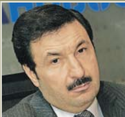
ректор Академии народного хозяйства при правительстве РФ Владимир Мау