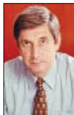
Иван Мельников , первый зампред ЦК КПРФ, заместитель председателя Государственной думы РФ

МАРШИ «ПУСТЫХ КАСТРЮЛЬ» ВО ВРЕМЕНА ЕЛЬЦИНСКИХ РЕФОРМ БЫЛИ ЕДВА ЛИ НЕ ЕДИНСТВЕННЫМИ СТИХИЙНЫМИ ПРОЯВЛЕНИЯМИ НЕДОВОЛЬСТВА