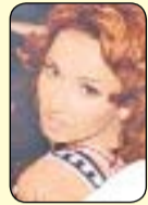
Анфиса Чехова («Секс с Анфисой Чеховой», ТНТ)

Неважно, что на самом деле было. Сюжет фантазией обогатив, Смерть Николая превратит он в «мыло», А жизнь Распутина преобразует в миф.