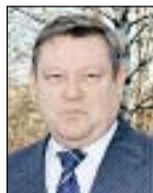
Валерий Сердюков, губернатор Ленинградской области:

Самая сложная ситуация в коммуналке, это, конечно, сегодня наш крест. Областные власти не оставляют ее без внимания, хотя по законодательству это зона ответственности муниципалитетов. Сегодня сталкиваемся с тем, что в Саратове управляющие компании до сих пор не получили средства, предназначенные для компенсации расходов по льготникам, которые областное правительство перечислило еще в четвертом квартале прошлого года. Зачастую в управляющих компаниях очень низкий уровень организации, менеджмента, поэтому принято решение провести обучение сотрудников предприятий коммунальной сферы. В этом году тарифы на коммунальные услуги в Саратовской области выросли ниже уровня, установленного федеральным правительством, такая же задача ставится и на следующий год.