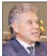
Павел Ипатов, губернатор Саратовской области:

Подорожание отечественных товаров в связи с изменением валютного курса наблюдается повсеместно. В федеральном правительстве заговорили об «опасной тенденции». Государство готово при необходимости влиять на цены социально значимых продовольственных товаров, объявил в минувшую субботу первый вице-премьер РФ Игорь Шувалов. Какой видится ситуация на местах? Вопрос: «Может ли региональная власть сдерживать рост цен? Каким образом?» — редакция «России» адресовала напрямую губернаторам.