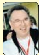
Вячеслав Зайцев («Модный приговор», Первый)

Не размножается Анфиса, Ей некогда детей рожать: Кто, кроме Чеховой, сумеет О сексе людям рассказать. Она не практик — теоретик, Важней рассказ ей, чем процесс. Ах, кто бы нам открыл секретик, Как слово заменяет секс.