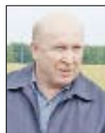
Валерий Шанцев, губернатор Нижегородской области:

И разумеется, никакой кризис не остановит набранное ускорение в рамках приоритетного национального проекта «Развитие АПК». Так, на птицефабрике «Роскар» завершена реконструкция четырехэтажного птичника на 296 тыс. кур-несушек. Да, мы не исключение, и кризис ударил по Ленобласти так же, как и по другим, но сдаваться мы не собираемся. Регион № 47 способен грамотно ему противостоять.